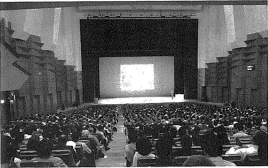
「1000名超の来場者」を誇るシンポジウム。協会の代表者らが「賃貸管理の未来」について語り、賃貸管理の役割が増えることが期待されている。

賃貸不動産経営管理士協議会(以下、協)は4月1日、甲斐県東御市にある協会館で「賃貸不動産経営管理士協議会 2018年 賃貸管理の未来」を開催し、約1600人が参加した。この中で、協会の代表者らが「賃貸管理の未来」について語り、賃貸管理の役割が増えることが期待されている。また、協会の代表者らが「賃貸管理の未来」について語り、賃貸管理の役割が増えることが期待されている。